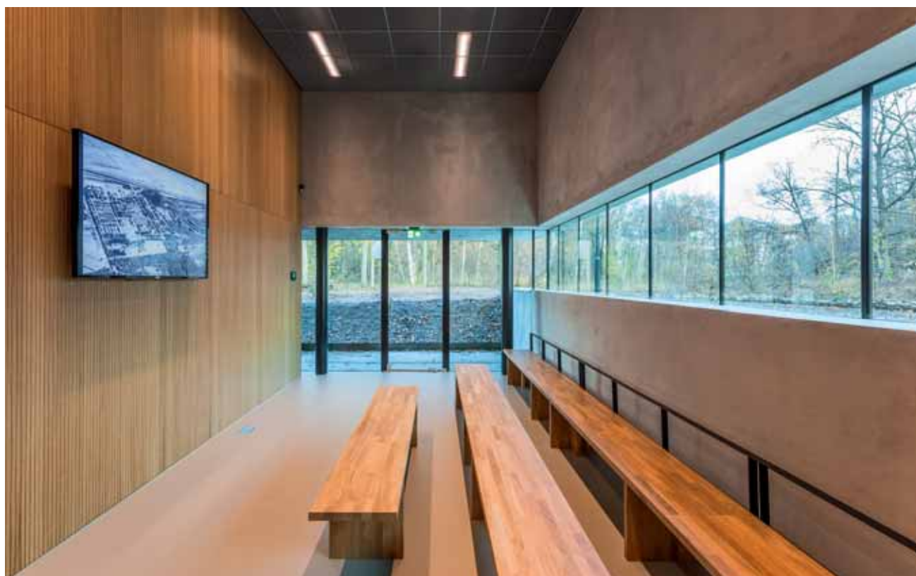
FOTO BOVEN Het nieuwe auditorium, een lange zaal over de gehele breedte van de tribunetrap in de uitbreiding.

Een goede routing was heel belangrijk omdat het museum de laatste jaren veel meer bezoekers krijgt, waaronder groepen jongeren en kinderen. Strijkers: "Die komen vaak heel druk en springerig uit een bus en moeten op een goede manier opgevangen worden. Dat kan in de drie leslokalen van de uitbreiding, waar ze een introductiefilm te zien krijgen. De expositie is niet specifiek voor kinderen ontworpen, daarom krijgen ze extra