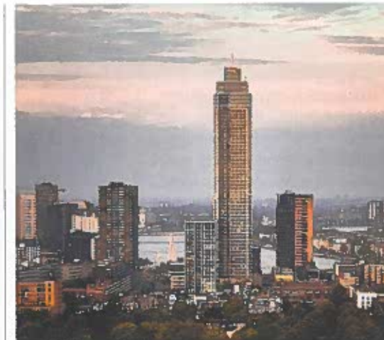
Links: binnen bij Celest; rechts: de 215 meter hoge Zalmhaventoren.